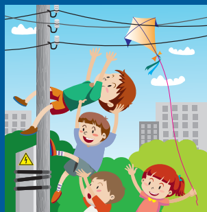
Нельзя играть вблизи линий электропередачи!