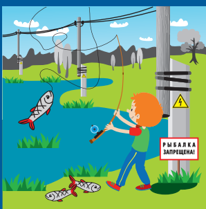
Нельзя ловить рыбу рядом с линией электропередачи!