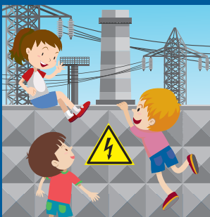
Не придумывай как достать или проникнуть! Позови взрослых!